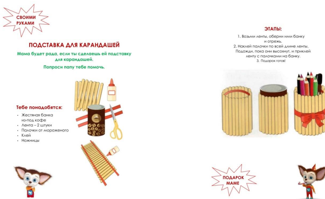
Рис. 3. Тренировочное задание Мастерской «Умелые ручки»

В результате конкурса все участники были награждены почетными грамотами и ценными призами.