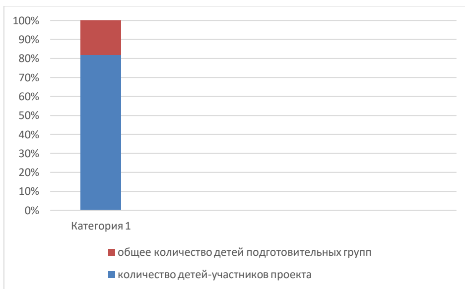
Рис. 6. Количественные результаты проекта

Количественные: Всего в проекте приняло участие 80% детей старшего дошкольного возраста. (Рис.6.) Это свидетельствует о вовлеченности родителей и педагогов, т.к. проект нацелен на всех участников образовательных отношений. Очевидно, что выполнение заданий в рамках проекта детьми не представляется возможным без участия помогающих взрослых.