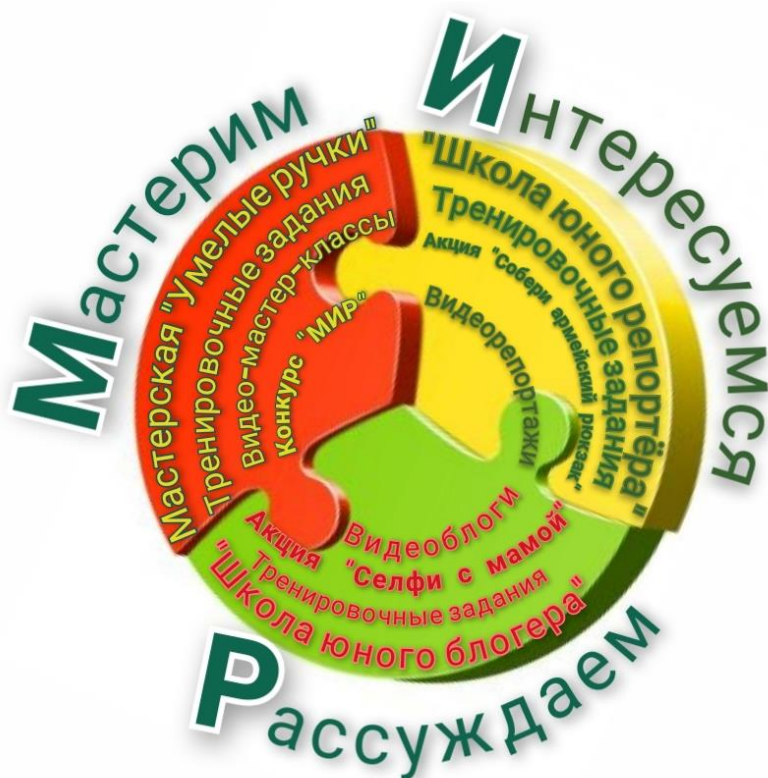
Рис. 1. Схема Проекта «Мы-МИР»

дети вместе с родителями выполняли тренировочные задания, практиковались в записи видеоматериалов и принимали участие в акциях и конкурсах. Если тренировочные задания и запись видеоматериалов рассчитаны только на участников проекта, то в конкурсных мероприятиях могли принять участие все желающие. Проект нацелен на долгосрочную перспективу.